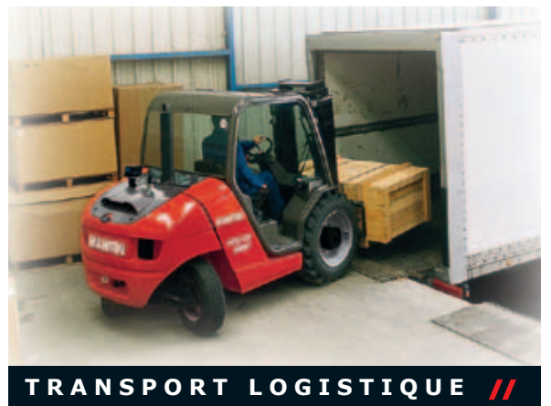
TRANSPORT LOGISTIQUE //